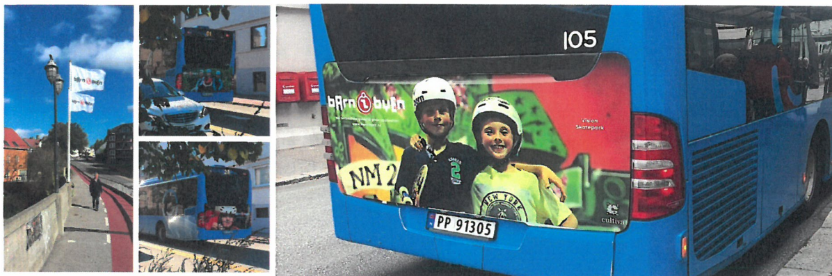
(flagg bybroa/ busseksponering 2016)

Hva: Fotoutstilling- eksponering på busser i Kristiansandsområdet/bildene i storformat. Når: oktober 2017